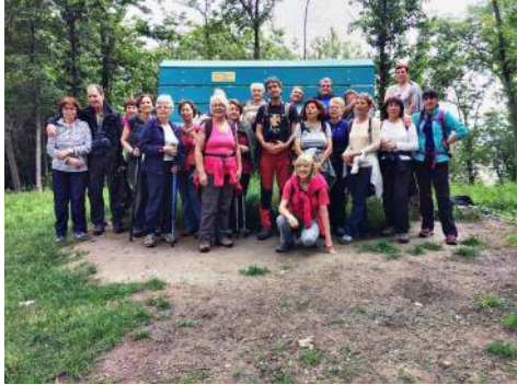
Séjour à Valgrana (Italie) 2018