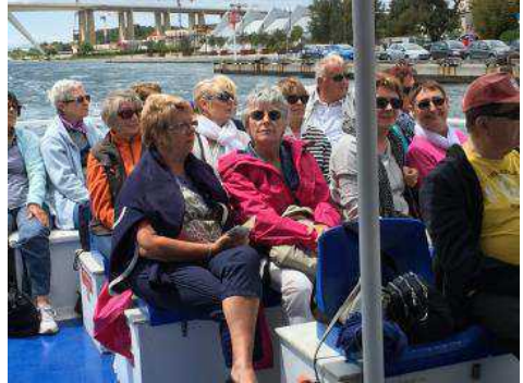
Sortie à Martigues 2016